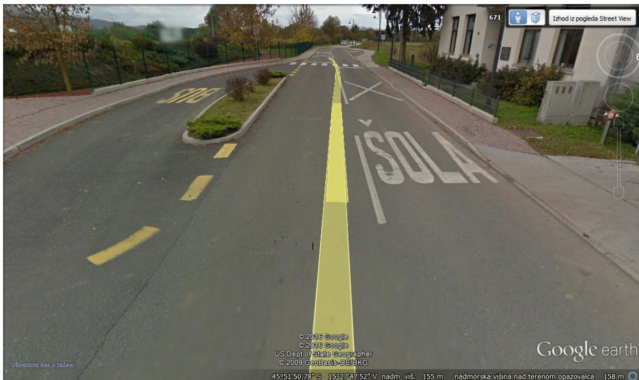
Prehod na severni strani šole iz strani Broda