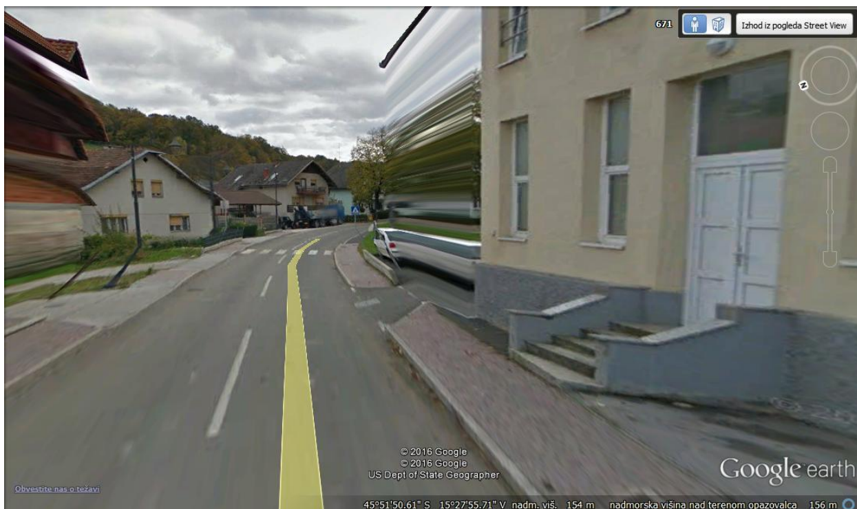
Prehod na severovzhodni strani iz strani Podbočja