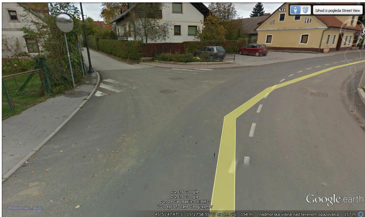
Prehod na jugovzhodni strani proti šoli iz strani Šutne