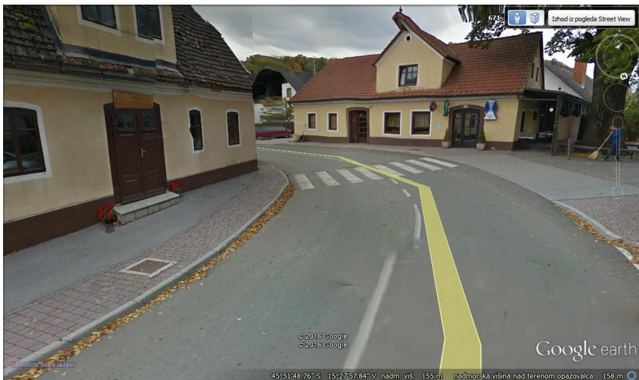
Prehod – vzhodna stran